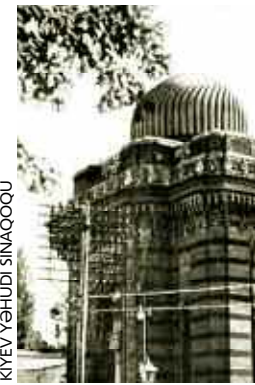
KİYEV YƏHUDİ SİNAQOQU

LAKİN... Lev Nussimbaumun (o, uzun illər sonra Əsəd Bəy təxəllüsü ilə yazmağa başladı) doğum şəhadətnaməsi Kiyevdəki sinaqoqda qeydiyyata alınmış və hal-hazırda bu sənədlər Ukraynada Kiyev Milli Arxivlərində saxlanılır. 4 Bakıda onun doğumu ilə bağlı heç bir sənəd tapılmayıb. 5